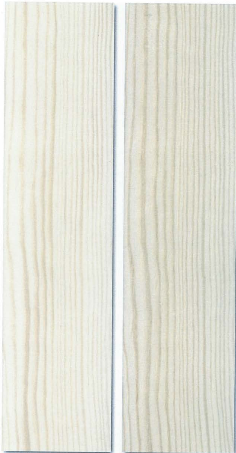
Abbildung 1: Probe 1 - Kiefer mit KaWaTech HMS9 beschichtet - unbewittert (links), nach 1 Jahr Freilandbewitterung (rechts)