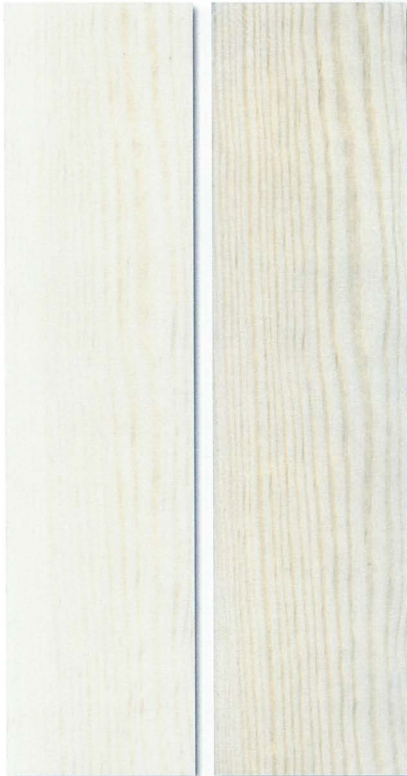
Abbildung 2: Probe 2 - Kiefer mit KaWaTech HMS9 beschichtet - unbewittert (links), nach 1 Jahr Freilandbewitterung (rechts)