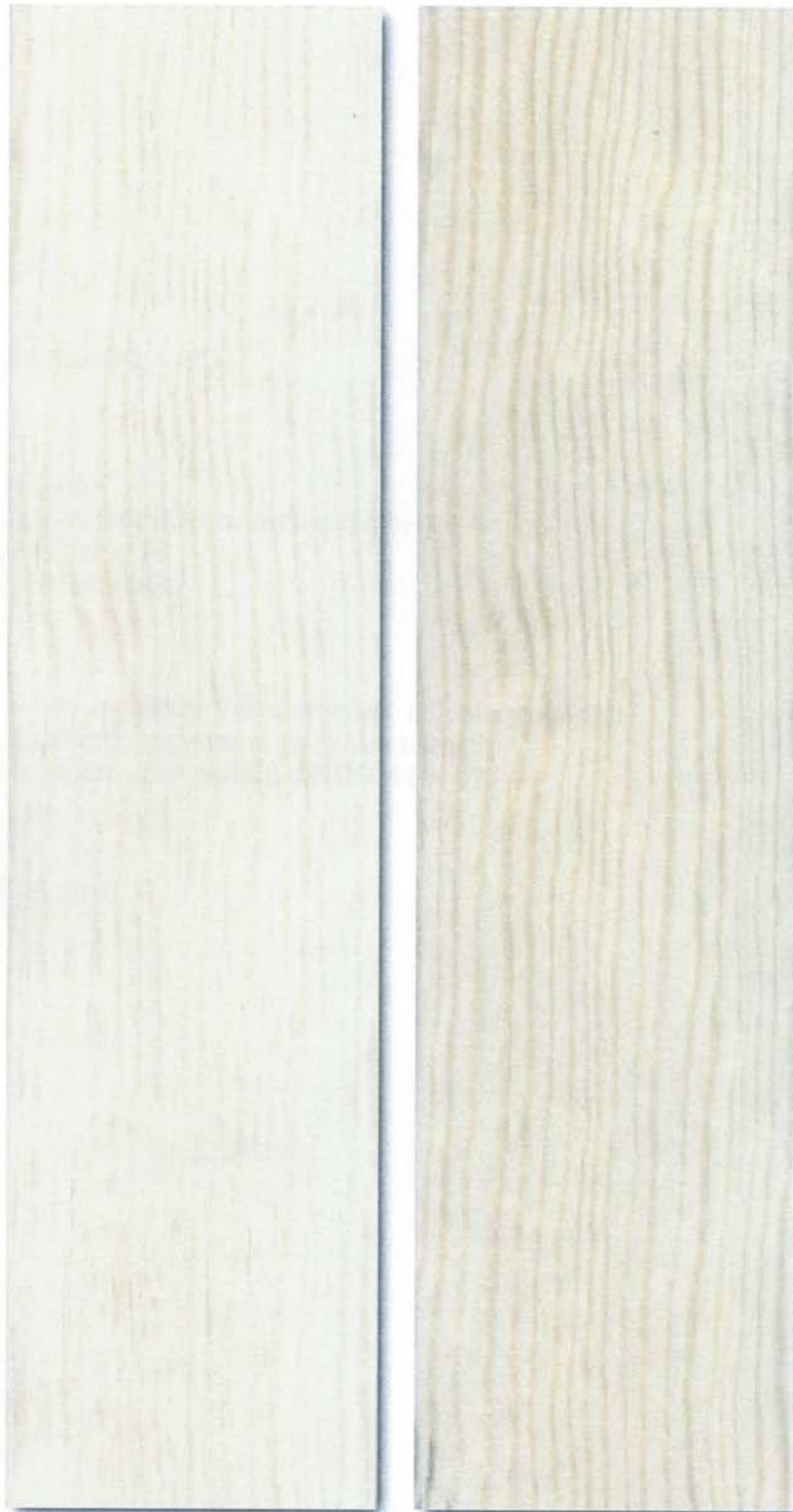
Abbildung 3: Probe 3 - Kiefer mit KaWaTech HMS9 beschichtet - unbewittert (links), nach 1 Jahr Freilandbewitterung (rechts)